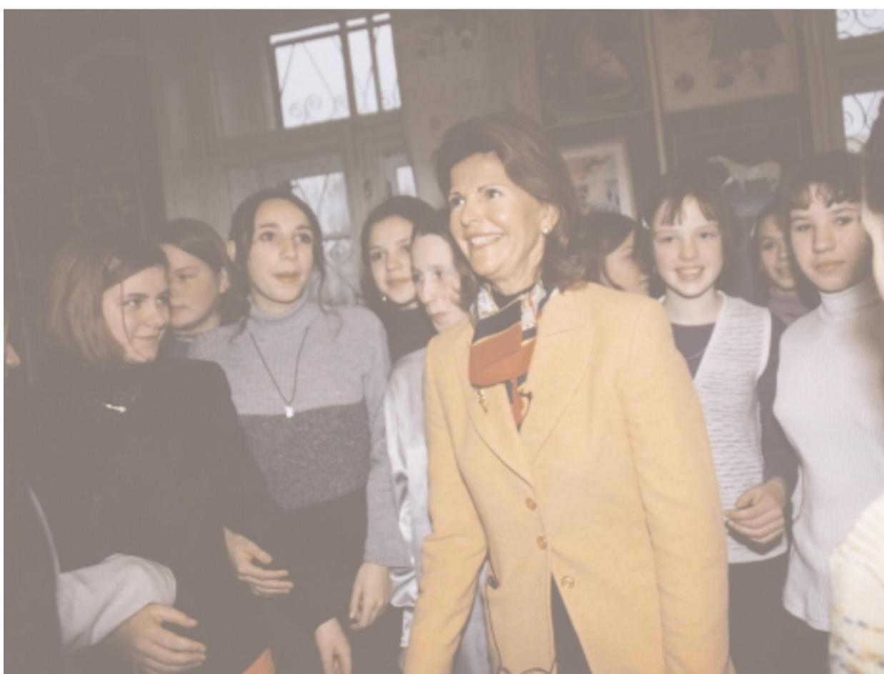
Молодые девушки-воспитанницы Малоохтинского Дома приветствуют королеву Швеции Сильвию.

Памятный фонд Сузанны Вестерберг gittanw@swipnet.se