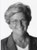
Ингела Тален Министр по семейным вопросам